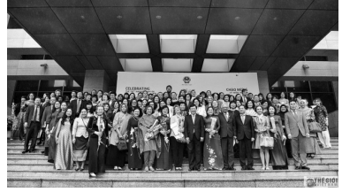
Phó Thủ tướng, Bộ trưởng Bộ Ngoại giao Phạm Bình Minh chụp ảnh chung cùng khách mời và các cán bộ của Bộ Ngoại giao tham dự lễ kỷ niệm.

Phát biểu tại buổi gặp mặt, Phó Thủ tướng, Bộ trưởng Bộ Ngoại giao Phạm Bình Minh nhấn mạnh vượt qua nhiều khó khăn, thách thức, với lòng đam mê nghề nghiệp, với khả năng quán xuyến, nhạy bén xã hội, khả năng kết nối rộng rãi và hơn hết là khả năng thấu hiểu và cảm thông, chị em đã thực sự phát huy được "sức mạnh mềm" của ngoại giao, gắn kết con người, gắn kết các cộng đồng và các dân tộc, đưa trái tim đến với trái tim, vì hòa bình giữa các dân tộc.