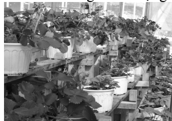
Cây dâu tây phát triển xanh tốt trên vùng đất nắng gió Ninh Thuận.

có khoảng hơn 5.000 chậu đang được chăm sóc rất cẩn thận. Dâu tây ở đây có vỏ căng mọng, quả không quá to, chín đỏ, có vị chua ròn rột và thoảng hương sữa rất đặc biệt. Bà Hương cho biết thêm: “Khoảng 02 đến 03 ngày tùy vào tình hình phát triển của cây mà có mức tưới cho phù hợp. Sữa chua đã ủ lên men được pha với nước lã với tỷ lệ trung bình khoảng 200 ml sữa chua đã ủ lên men hòa với 15 lít nước khuấy đều rồi đem tưới cho cây, ngoài ra không dùng bất cứ loại thuốc bảo vệ thực vật nào để chăm sóc cây dâu nên trái rất an toàn cho người sử dụng”.