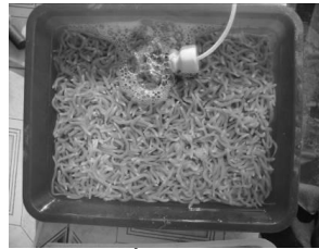
Sá sùng giống

- Chất đáy: đáy cát bùn (70-80% cát, 20-30% bùn tính theo khối lượng), hoặc cát pha ít vỏ động vật thân mềm và bùn (70-80% cát và vỏ động vật thân mềm, 20-30% bùn tính theo khối lượng), đáy xốp, bước qua có dấu chân, tránh các ao cát quá mịn, đáy cứng, đáy bị nhiễm phèn. Độ sâu tối thiểu của lớp cát bùn 25 cm.