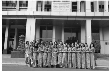
Chị em Sở Khoa học và công nghệ mặc áo dài trong ngày 6/3, hưởng ứng sự kiện “Áo dài - Di sản văn hóa Việt Nam”.

- Tổ chức các hoạt động “Tặng Áo dài cho học sinh và phụ nữ khó khăn” trên địa bàn tỉnh Bà Rịa – Vũng Tàu.